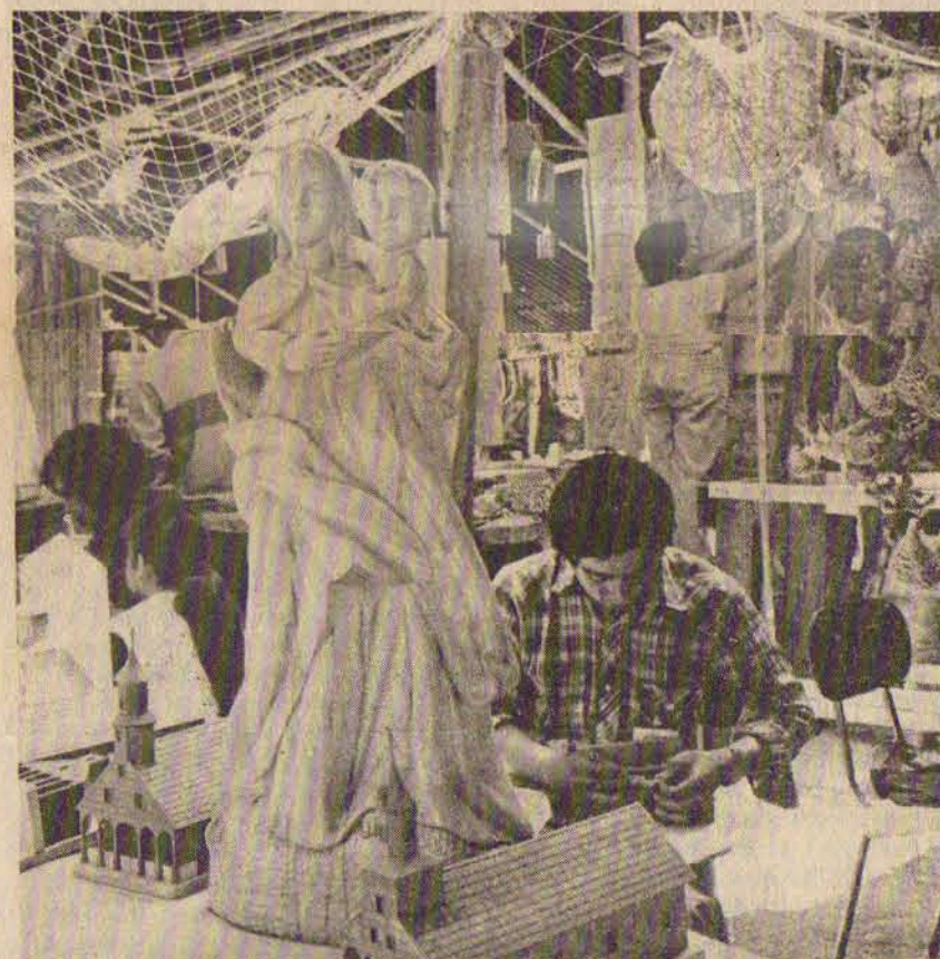
Feria Artesanal del Parque Bustamante: cabida solamente para lo artesanal, no así para las manualidades.

recinto es pagada. Sin embargo, Berg enfatiza que esto no lo utilizan tanto para catalogarla o seleccionar a los visitantes, sino porque necesitan autofinanciarse. En este sentido destaca que la Feria del Parque Bustamante se financia en un 100 por ciento: “Los gastos son de aproximadamente 14 millones de pesos y el ochenta por ciento de ese monto se obtiene a través de la entrada que se cobra al público”. A juicio del director de programación de la U.C. las ferias artesanales tienen por misión vincular a las mayorías con la creación de un artesano, y como tales deben orientarse a la búsqueda de lo que es representativo del sentir nacional.